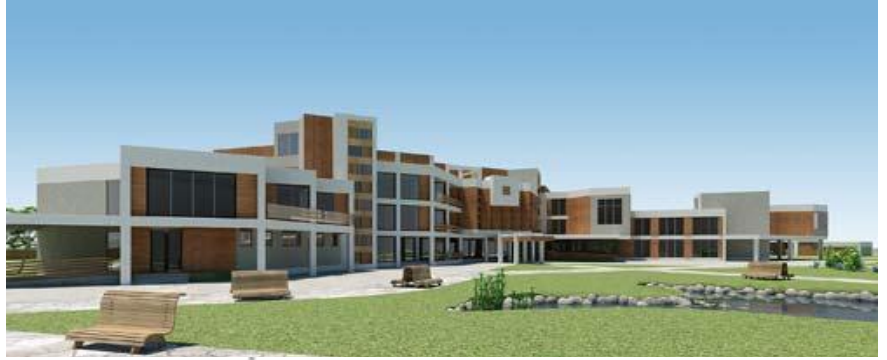
Տարբերակ 1. Շենքային համալիրի կառուցում՝ համապատասխան մասնաշենքերով: