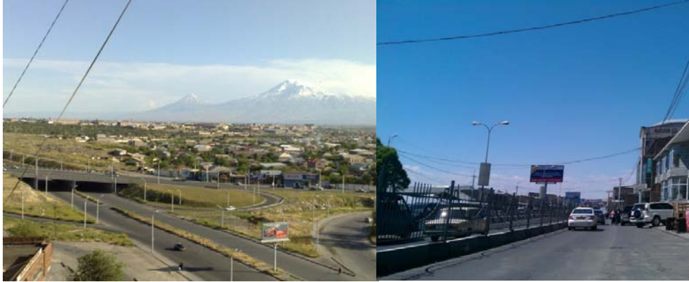
Արգավանդի տրանսպորտային հանգույց

Առկա է «Երևան նախագիծ» ՓԲԸ կողմից մշակված էքսիզային տարբերակ: